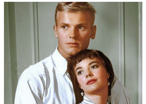
1956 THE GIRL HE LEFT BEHIND de David Butler avec Natalie Wood