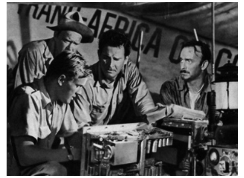
1953 THE STEEL LADY d'Ewald Andre Dupont avec Rod Cameron, John Abbott