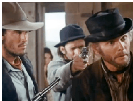
1972 JUGE ET HORS-LA-LOI (The life and times of Judge Roy Bean) de John Huston avec Matt Clark