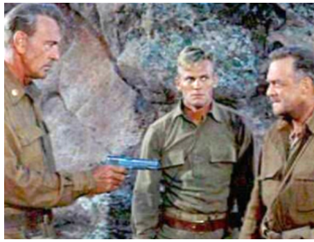
1959 CEUX DE CORDURA (They came to Cordura) avec Robert Rossen avec Gary Cooper, Van Heflin