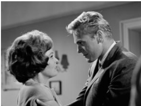
1964 LES EAUX TROUBLES (Troubled Waters) de Stanley F. Goulder avec Zena Walker