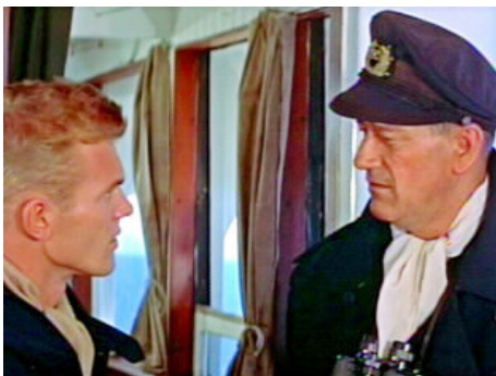
1955 LE RENARD DES OCÉANS (The Sea Chase) de John Farrow avec John Wayne