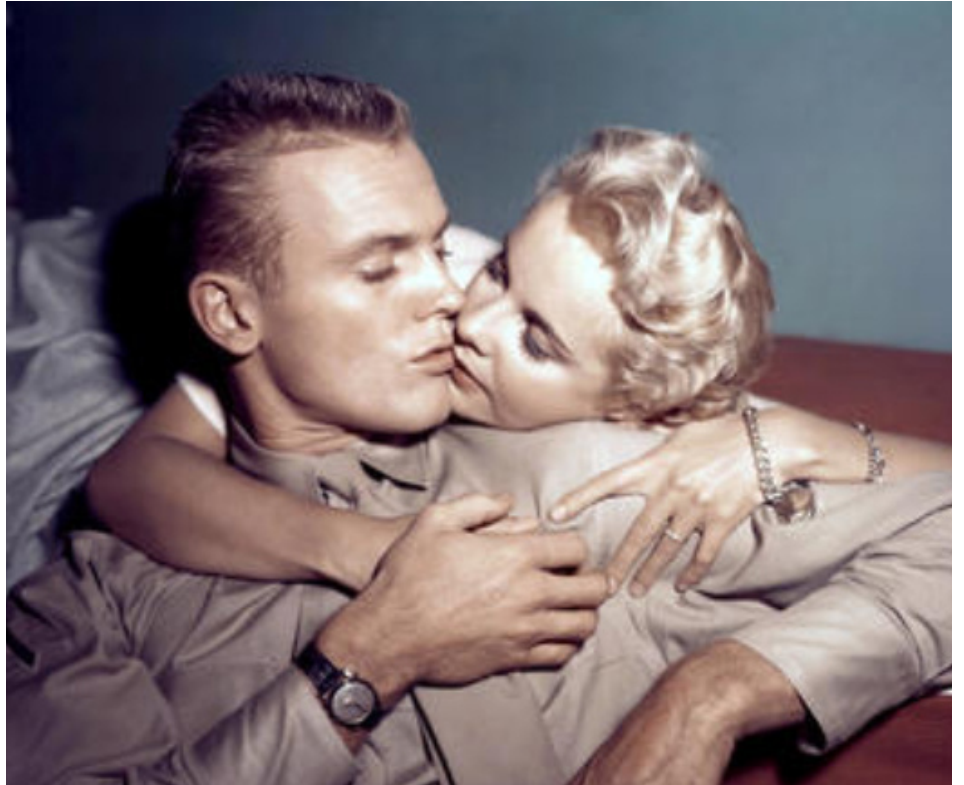
1955 LE CRI DE LA VICTOIRE (Battle Cry) de Raoul Walsh avec Mona Freeman