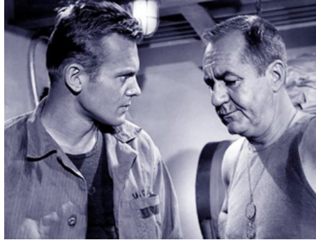
1963 COMMANDO BIKINI (Operation Bikini) d'Anthony Carras avec Jim Backus