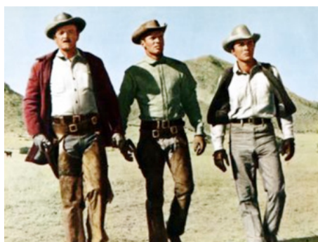
1958 LE SALAIRE DE LA VIOLENCE (Gunman's Walk) de Phil Karlson avec Van Heflin, James Darren