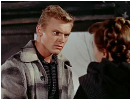
1954 TRACK OF THE CAT (Track of the Cat) de William A. Wellman avec Teresa Wright