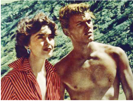
1954 RETOUR À L'ÎLE AU TRÉSOR (Return to Treasure Island) d'E. A. Dupont avec Dawn Addams