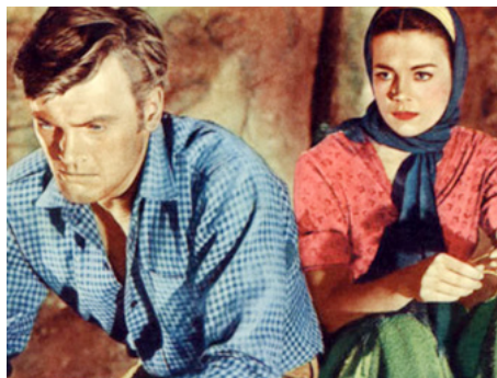
1956 COLLINES BRÛLANTES (The Burning Hills) de Stuart Heisler avec Natalie Wood