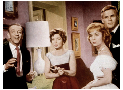
1961 MON SÉDUCTEUR DE PÈRE (The Pleasure of his Company) de G. Seaton avec Fred Astaire, Lilli Palmer, Debbie Reynolds