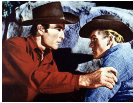
1953 TEMPÊTE SUR LE TEXAS (Gun Belt) de Ray Nazzaro avec George Montgomery