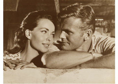
1964 LES DOMPTEURS DU PACIFIQUE (Ride the Wild Surf) de Don Taylor avec Susan Hart