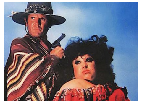
1985 LUST IN THE DUST (Lust in the Dust) de Paul Bartel avec Divine