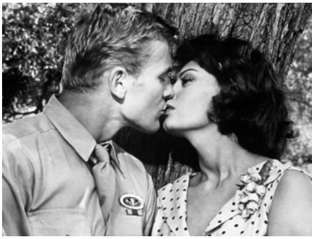
1959 UNE ESPÈCE DE GARCE (That Kind of Woman) de Sidney Lumet avec Sophia Loren