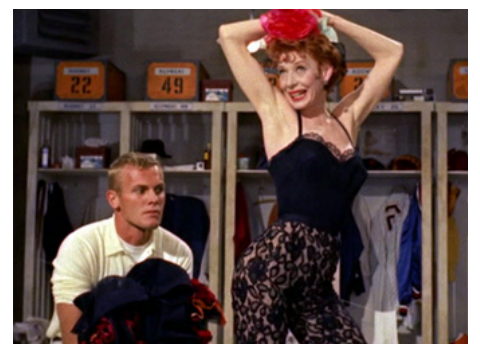
1958 CETTE SATANÉE LOLA (Dawn Yankees) de George Abbott & Stanley Donen avec Gwen Vernon