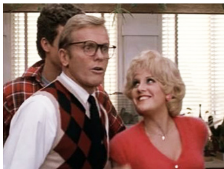
1982 GREASE 2 (Grease 2) de Patricia Birch avec Lorna Luft