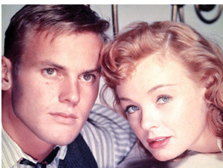
1958 C'EST LA GUERRE (Lafayette Escadrille) de William A. Wellman avec Etchika Choureau