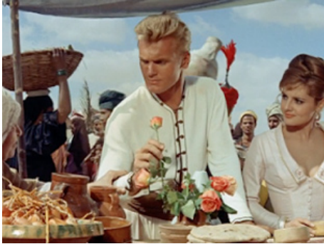
1962 LA FLÈCHE D'OR (L'arciere delle mille e una notte) d'Antonio Margheriti avec Rossana Podesta