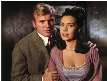
1965 LA CITÉ SOUS LA MER (War-Gods of the Deep) de Jacques Tourneur avec Susan Hart