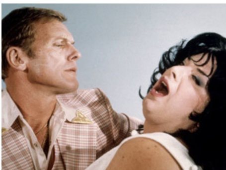
1981 POLYESTER (Polyester) de John Walters avec Divine